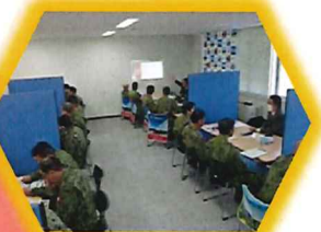
業種説明会の実施