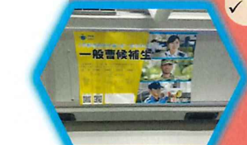
自衛官募集情報等の掲示への協力