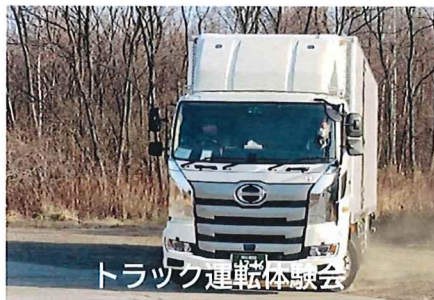
トラック運転体験会