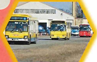
車両運転体験会等の実施