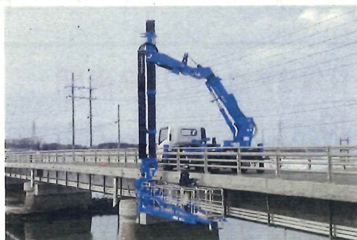
◀ 橋梁点検イメージ